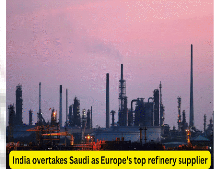
India overtakes Saudi as Europe's top refinery supplier

(B) केप्लर के आंकड़ों के अनुसार भारत सऊदी अरब को पीछे छोड़ते हुए यूरोप में रिफाईंड ईंधन का सबसे बड़ा आपूर्तिकर्ता बन गया है। यह रूसी तेल तक यूरोपी की कम पहुंच और भारतीय कच्चे तेल उत्पादों पर उनकी बढ़ती निर्भरता के परिणामस्वरूप आता है। यूरोप भारत से अपने परिष्कृत ईंधन आयात को प्रति दिन 360,000 बैरल से अधिक बढ़ाने के लिए तैयार है, हालांकि यह अंततः मास्को के कच्चे तेल की अधिक मांग पैदा करता है, जो माल दुलाई लागत वहन करता है।